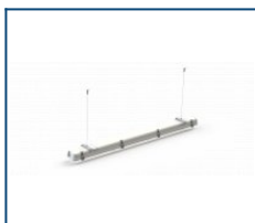
Тросовый подвес для LPO/LSP (комплект, 1 м)